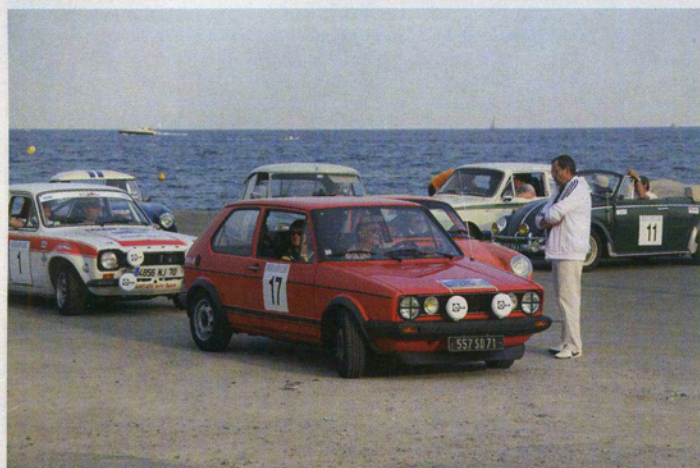
La satisfaction d'atteindre la Méditerranée.