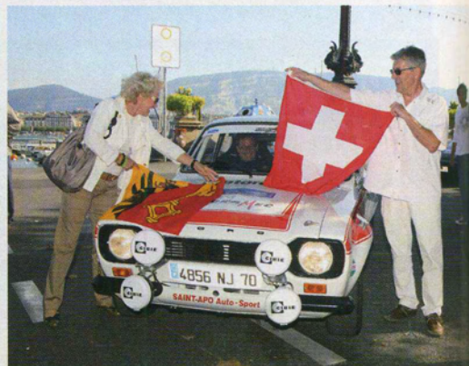
Grâce à la collaboration efficace de la ville de Genève, le rallye a pu partir devant le célèbre jet d'eau.